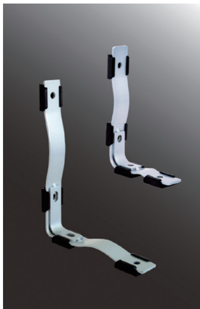
グレートホルダー1型（左）／2型（右）