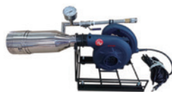
トルトル4型（専用架台付） 基礎の換気口やコア抜きした基礎面に設置する専用発泡機。