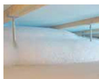
床下での発泡状況