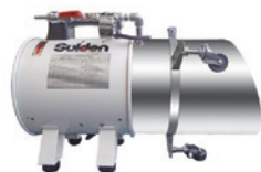
トルトルニュージャンボ18改 床下収納庫や床下点検口に設置する専用発泡機。