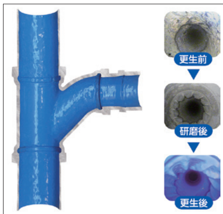
施工後の管内と各施工工程での管内状況