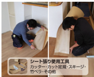
シート張り使用工具 カッター・カット定規・スキージ・竹べら・その他

各現場に合わせてカットしたシートをフローリングに張る。床だけでなく、玄関框や階段にも施工できる。