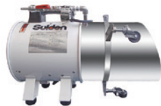
トルトルニュージャンボ18改 床下収納庫や床下点検口に設置する専用発泡機。