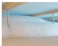
床下での発泡状況