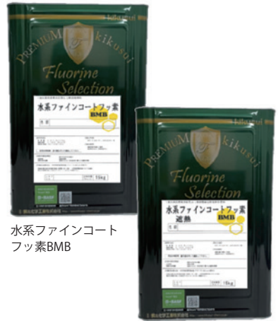
水系ファインコート フッ素BMB

また、高耐久性安定剤「Tinuvin®（チヌビン）」を配合することにより、紫外線による経年劣化防止に高い効果を発揮する。