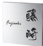
カポット SPBK-25 ステンレスHL