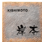
ART-523 白金彩 (金彩)