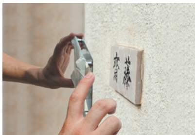
ペタット施工イメージ