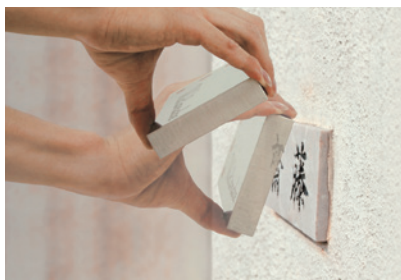
カポット施工イメージ (厚みは最低8mmまで可能)