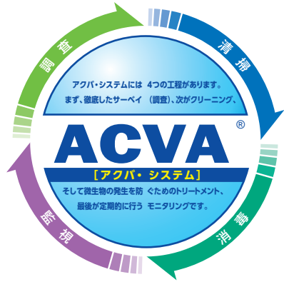
システムイメージ図

「調査」「清掃」「消毒」「監視」の4つの工程により、空調システムの衛生的な保守管理を計画的・断続的に行うことができる。