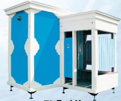
コンラットM 男子トイレ