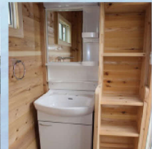
鏡付き洗面台・荷物置き