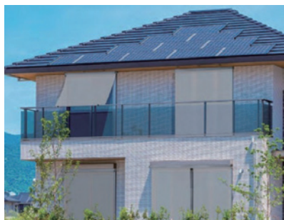
施工例（高遮熱生地）