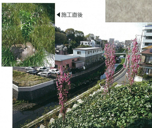
のり枠緑化 ハナモモは施工後4年でH=3m程度に生長。グランドカバー として植栽したヘデラがのり枠を被覆修景(神奈川県)