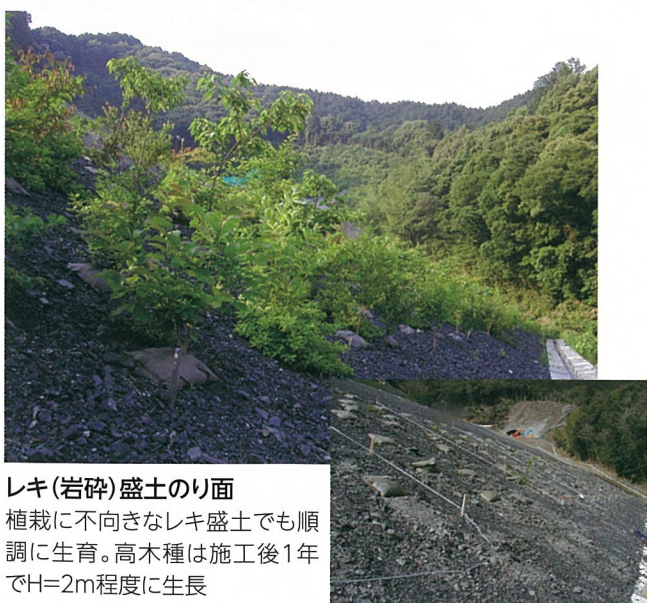
レキ(岩砕)盛土のり面 植栽に不向きなレキ盛土でも順 調に生育。高木種は施工後1年 でH=2m程度に生長 (静岡県)