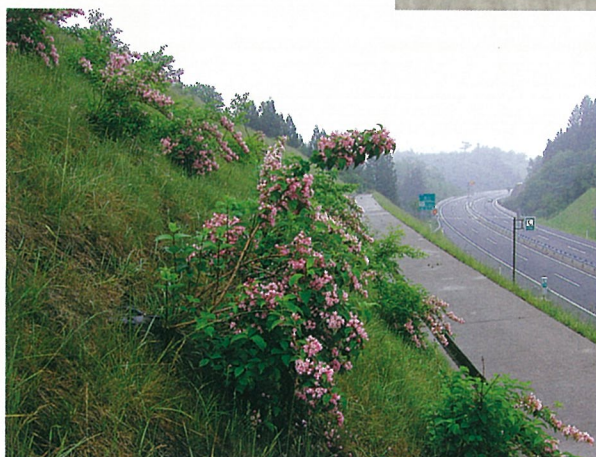
地域性種苗利用工として、自生種掘り取り苗を使用 現地で山取りした苗木をパックに植付けてのり面に張り付け。 良好に生育を続け、タニウツギが一斉に開花(岐阜県)