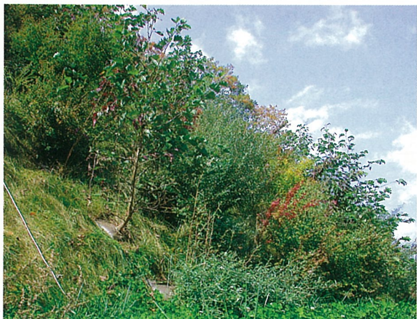
植穴掘削が困難な軟岩切土のり面への苗木植栽 早期自然復元を目指し、多様な樹種を使用 施工後2年でH=4m程度に生長(岐阜県)