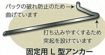
固定用 L 型アンカー