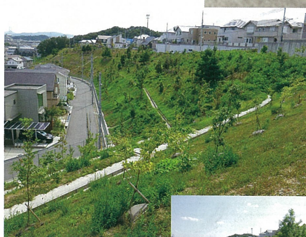
宅地造成のり面 植穴掘削が困難な造成のり面に 張り付け。新興住宅地に雑木林 を復元(兵庫県)