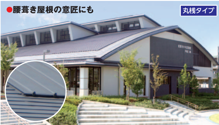
恵那市中央図書館